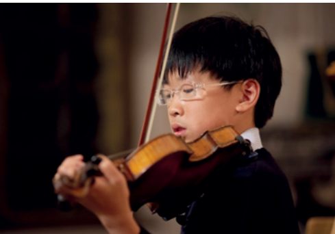
Individuelle Förderung der musischen Begabungen