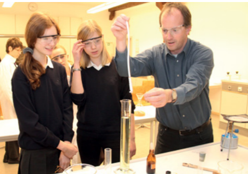
Naturwissenschaften in Salemer Schlossmauern