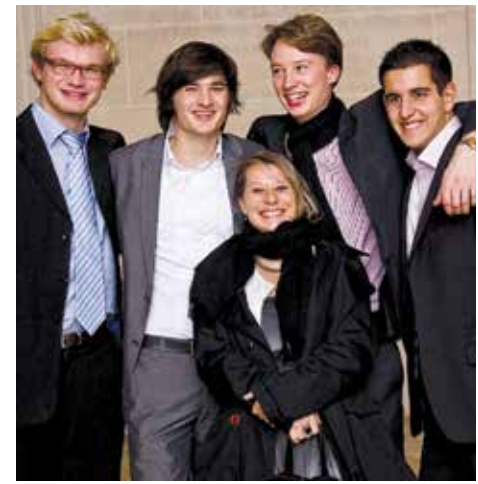
Strahlende Gesichter bei der feierlichen Diplomverleihung an die Bachelor-Absolventen am 11. Dezember 2009 im Rathaus von Nancy